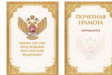
Почетная грамота Министерства просвещения РФ