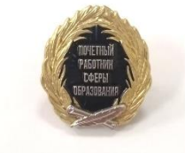
Почетное звание «Почетный работник сферы образования РФ»