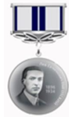
Медаль Л.С. Выготского