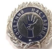
Нагрудный знак «Почетный наставник»