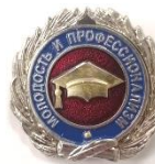
Нагрудный знак «Молодость и профессионализм»