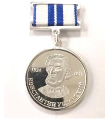
Медаль К.Д. Ушинского