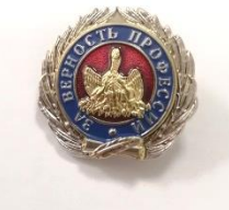
Нагрудный знак «За верность профессии»