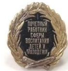
Почетное звание «Почетный работник в сфере воспитания детей и молодежи РФ»