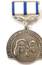
Нагрудный знак «За милосердие и благотворительность»