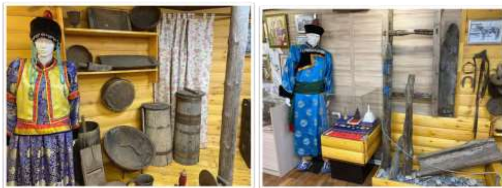
Мужской вариант костюма.

Традиционная одежда бурят была представлена в зимнем (бур. дэгэл) и летнем (бур. тэрлиг) вариантах. Мужской халат обычно шили из тканей синего цвета, иногда коричневого, темно-зеленого, бордового. Обязательным атрибутом мужского халата были пояса. Верхняя одежда была прямо спинной, то есть не отрезной по талии, с длинными расширяющимися книзу подолами. На вороте пришивали от одной до трех серебряных, коралловых, золотых пуговиц. Следующие пуговицы пришивали на плечах, под мышкой и самую нижнюю — на талии. Верхние пуговицы считались приносящими счастье, благодать.