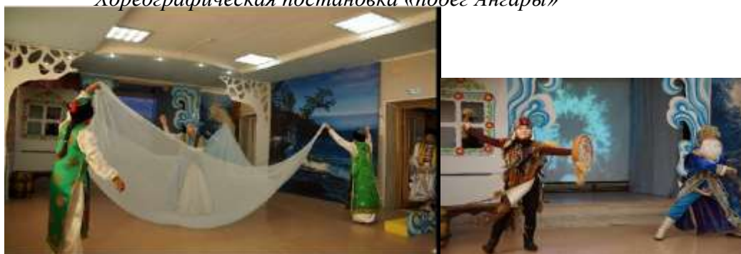
Хореографическая постановка «побег Ангары»

Внук: Ну, поздравили друг друга, а теперь пора бы и перекусить?!